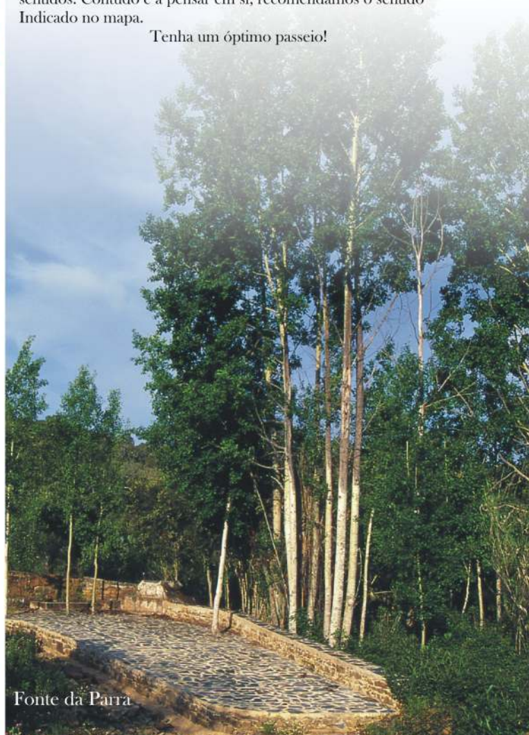
Fonte da Parra