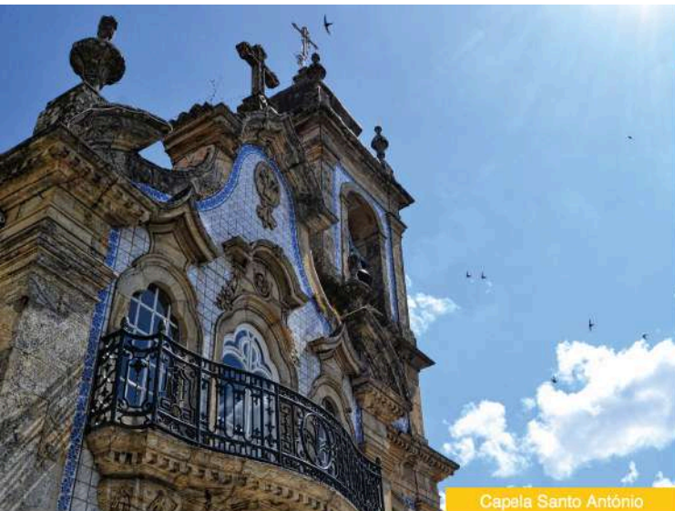
Capela Santo António