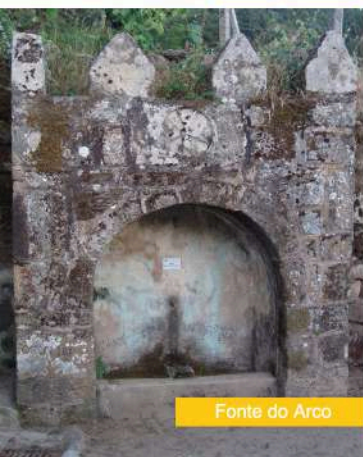
Fonte do Arco