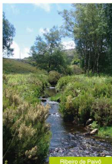
Ribeiro de Palvó