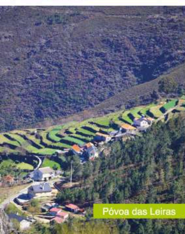
Póvoa das Leiras