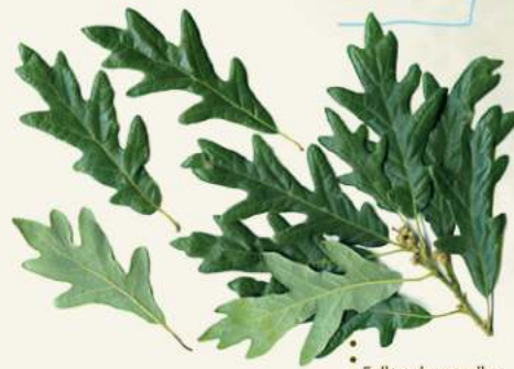
• Folhas de carvalho