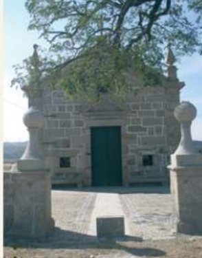
• Sr.ª do Refúgio