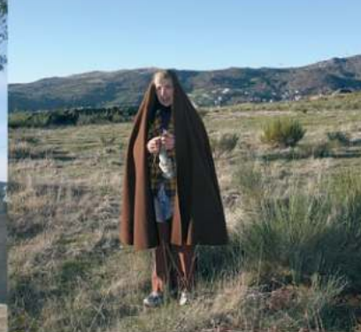
• Pastora com capucha