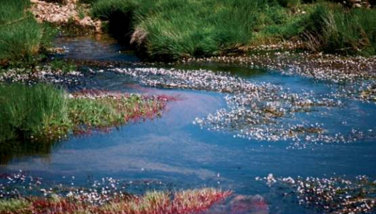
• Rio Balsemão