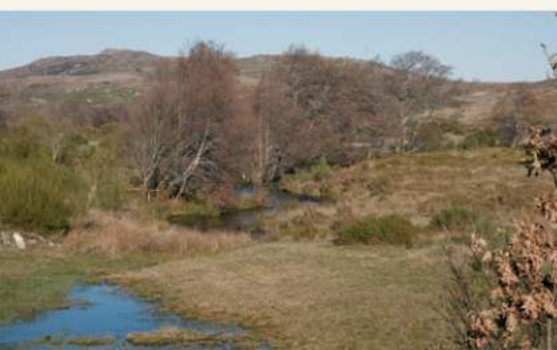
• Trufeiras do rio Balsemão

Em direcção à povoação de Codeçal, podemos visualizar manchas de carvalhos bem conservadas da espécie Quercus pyrenaica .