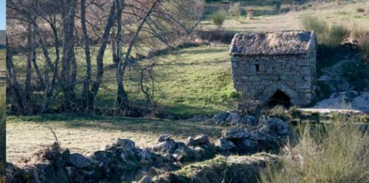
• Moinho em Gosendinho

“A montanha oferece-se esplendorosa...sobre o Nascente levanta-se, como gigantesca cortina, uma aba da serra e a gente interroga-se acerca dos Homens que, primeiramente, se fixaram nestes lugares...Um Homem sente-se pequeno!”