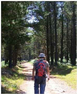
Bosque de coníferas

A capela de Santa Ana e a de S. Pedro de Rates também lá se encontram e, na verdade, o que não falta são os espaços de invocação religiosa, tal como religioso é o sentimento que invade o visitante quando contempla, lá do alto, a imensa paisagem distendida no sopé, riscada pelo azul serpenteante do rio Minho que se alonga por entre as montanhas de Galiza e Portugal adornadas de um verde intenso.