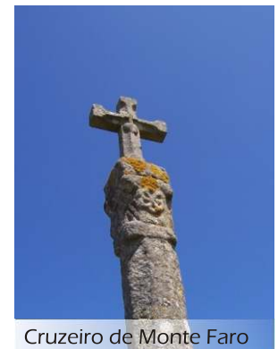
Cruzeiro de Monte Faro

quais o verbasco e a urze, o omnipresente tojo de flores amarelo intenso onde nidifica e se esconde a toutinegra carrasqueira, a carqueja e o dente-de-leão, a abrótega em cuja haste gosta de poisar o cartaxo comum e tantos outros, afinal. Então, que espera? Venha daí.