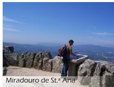
Miradouro de St.ª Ana

sonoridade mágica, os patamares de leiras e campos, os rebanhos de ovelhas, vacas e garranos que se alimentam da erva espontânea que veste as encostas. À medida que o trilho desenha o contorno da serra outras paragens se nos vão oferecendo na sua simplicidade e na timidez que a distância lhe confere. Timidez e também o convite que naquele momento só o olhar aceita. Monção perfila-se ao fundo, ao lado, num ângulo de noventa graus, são as terras de Paredes de Coura que se insinuam. Mais perto, junto dos pés do caminhante, são as espécies vegetais que disputam a atenção de quem passa. E são muitas, entre as