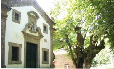
Capela da Sr.ª do Faro e Árvore centenária

O Monte de Faro aconchega-se sob as ramagens das suas inúmeras árvores, que nos recebem num abraço verde, pelo menos no local onde o trilho com o seu nome começa. As árvores são, de facto, muitas, frondosas e variadas, com os plátanos e tilias as quais, na época florida, impregnam o ar com um intenso e doce perfume, austrálias e castanheiros, carvalhos e pinheiros dominando o espaço inclinado, em patamares de fácil acesso, onde a água corre das bicas.