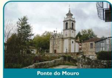
Ponte do Mouro

A entrada no concelho de Monção dá-se pela freguesia de Sá. Percorridos alguns quilómetros, entre florestas e vinhas, chega-se a Ponte do Mouro, podendo-se descansar no parque de merendas, ou à beira rio, na sombra de carvalhos centenários. Ponte de Mouro apresenta-se riquíssima em património, desde a Ponte Medieval propriamente dita, fronteira à Igreja de S. Félix, aos oratórios e cruzeiros, desde o rio e os seus moinhos, até ao relógio de sol. É ainda um excelente local para experimentar a gastronomia regional. Um pouco mais adiante, veja o invulgar espigueiro de Pedro Macau!