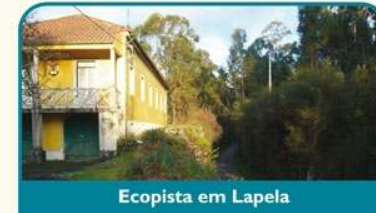
Ecopista em Lapela

A entrada na sede de concelho dá-se pelo Parque Termal e pelo seu passadiço de madeira que conduz à escadaria de entrada na muralha. O percurso segue sempre a face da muralha virada ao rio e a Espanha, mas este facto não deverá ser impedimento de uma visita atenta ao Centro Histórico de Monção. Comece pelo Turismo, na Casa do Curro, a dois passos do percurso!