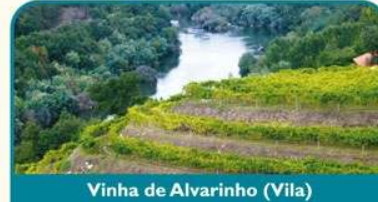
Vinha de Alvarinho (Vila)

deste surge um conjunto de Quintas onde é possível efectuar provas destes e de outros produtos regionais. Contacte com a Rota do Vinho Alvarinho desfrutando de um dos ex-libris da região, tão exclusivo quanto a paisagem que o acolhe e que também ele marca, único como a paixão que o produz. A poucas centenas de metros, situa-se o centro de Melgaço, onde poderá retemperar forças e desfrutar da cultura local.