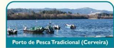
Porto de Pesca Tradicional (Cerveira)

Passando São Pedro da Torre, entra-se no concelho de Vila Nova de Cerveira, através de Chamosinhos. Após um breve trecho paralelo à linha férrea, segue-se para o rio, para não mais o largar até ao final da rota. Caminhando sempre dentro da vegetação ripícola, terá de um lado os férteis campos e do outro o rio, onde é possível ver inúmeros portos de pesca tradicionais e as redes - "artes de pesca" a secarem ao sol.