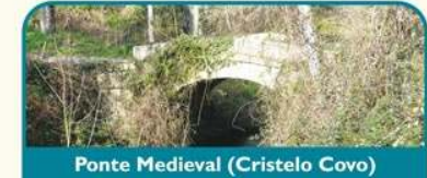
Ponte Medieval (Cristelo Covo)

Saindo de Valença, rapidamente se chega à Sr.ª da Cabeça, por onde se segue junto ao rio na companhia de garças e corvos-marinhos. Na freguesia de Cristelo Covo, o percurso inflecte ligeiramente para Este de forma a que acompanhando os caminhos de ferro, se visite uma zona de solos de aluvião com ricos campos e bosques. Chegados à ponte medieval, basta olhar para Este, para ver a Veiga da Mira - um área húmida de especial relevância para garças e aves limícolas.