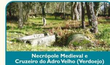
Necrópole Medieval e Cruzeiro do Adro Velho (Verdoejo)

Seguindo de Monção para Oeste, já na freguesia de Cortes, atravessando vinhas e carvalhais o percurso começa a serpentear entre o rio e a Ecopista do rio Minho. Rapidamente estaremos em Lapela, junto da Torre que dá nome à freguesia, conhecida localmente como a "Torre de Belém do Minho". Ainda estará a desfrutar a paisagem da Ínsua do Crasto, quando se aperceber de que já se encontra em Frietas - Valença. Da Ínsua, o percurso sobe novamente até à Ecopista, donde volta a sair rapidamente para entrar no trilho da foz do rio Manco, de elevado valor ecológico. Com um pouco de sorte, ver uma lontra a brincar no rio, não será difícil. Continuando a serpentear entre pinhais, carvalhais e veigas, chega-se ao cruzeiro do Adro Velho, à entrada da necrópole medieval de Verdoejo, com as campas antropomórficas veladas por carvalhos e sobreiros centenários.