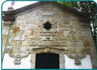
Capela de Nossa Sr.ª do Alívio (Pousaflores)

Desfrutando da magnífica vista sobre o planalto de Castro Laboreiro, inicia-se a descida para o vale do rio Trancoso, fronteira natural com Espanha. Já na freguesia de Fiães, não deixe de visitar Pousaflores, onde poderá ouvir as genuínas histórias da "época do contrabando".