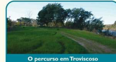
O percurso em Troviscoso

Retomando o percurso sente-se novamente a proximidade do rio, aqui já mais largo. Novamente se observam as pesqueiras e se desfruta da biodiversidade das margens do rio Minho. Já na freguesia de Troviscoso e tendo descido ao rio pelo meio de vinhedos, atravessa-se um raro prado nas margens do Minho. Um pouco mais à frente, uma área fluvial natural, "guardada" por um antigo Posto da Guarda-fiscal.