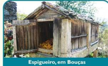
Espigueiro, em Bouças

Deixando para trás o Centro de Estágios de Melgaço segue-se um caminho de "pé posto". Este antigo caminho de pescadores que atravessa um belo carvalhal, representa uma das secções onde é maior a proximidade ao rio, sobrepondo-se a uma pequena rota - o Trilho das Pesqueiras, que como o próprio nome indica, se encontra repleto destas tradicionais estruturas. Seguindo na direcção de Monção, uma rede de caminhos agrícolas ladeados por campos e vinhas, bem como algumas estradas secundárias permitir-lhe-ão atravessar povoações e viajar pela etnografia local.