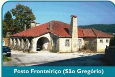
Posto Fronteiriço (São Gregório)

Retomando o percurso, o adro da Igreja de Cristóval, traduz-se num excelente miradouro sobre o vale do rio Trancoso. A próxima secção é marcadamente agrícola, com lameiros verdejantes pontuados com espigueiros. Chegando a São Gregório, o antigo Posto Fronteiriço merece uma visita, composto por vários edifícios de arquitectura típica do Estado Novo.