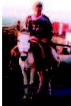
Covão das Pias

⑤ Pelo caminho vai passar por uma magnífica calçada em pedra calcária que lhe vai facilitar a chegada a duas pequenas explorações agrícolas e, logo depois, ao Picoto da Texugueira. A partir daqui tome a direcção do Parque de Campismo onde terminará este circuito pedestre.