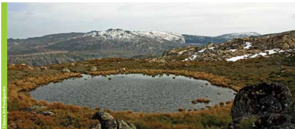
Charca do Perdigueiro