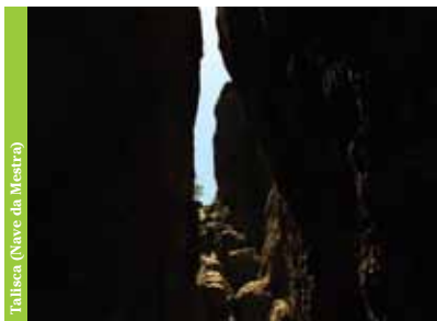
Talisca (Nave da Mestre)