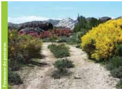
Pormenor do percurso