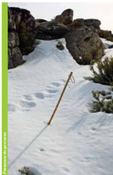
Por menor do percurso