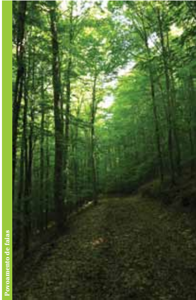
Povoamento de faias