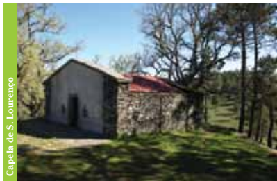
Capela de S. Lourenço

Para além desta espécie, também há a destacar o castanheiro , a giesta , o pinheiro-do-Oregon e os imponentes carvalhos monumentais que rodeiam a Capela de S. Lourenço , lugar de culto de reminiscências pagãs, relacionadas com a adoração das árvores e do Sol – no solstício de Verão, quem está em Manteigas vê o sol nascer sobre S. Lourenço.