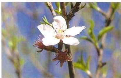
Flor da amendoeira