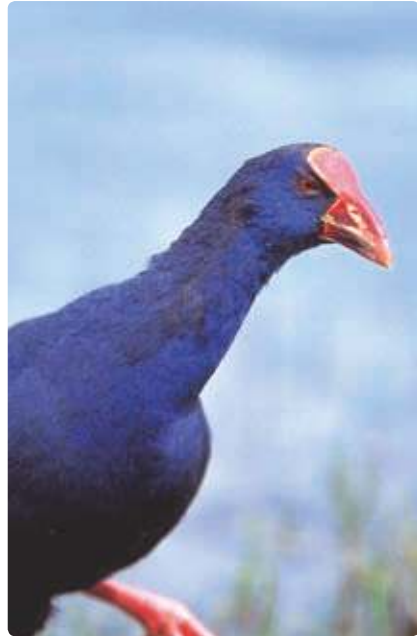
Camão Purple Swamphan

Aqui pode encontrar muitas espécies de aves, sendo um importante local para observação de aves (Birdwatching).