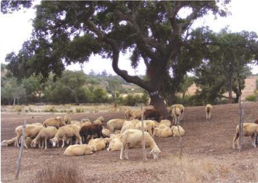
Rebanho de ovelhas Flock of Sheep

É uma zona de grande riqueza ambiental, permitindo a todos os amantes da natureza conhecer um espaço natural rico em fauna e flora, nomeadamente o sobreiral, alternado com matagais de esteva e de estevão, urzes, medronheiros, rosmaninhos bem como pinheiros, eucaliptos e pequenas hortas junto a linhas de água. Neste local é possível observar uma variada avifauna desde o melro, o pisco-de-peito-ruivo, a perdiz, até aos mamíferos como o javali, o coelho, a lebre, entre outros.