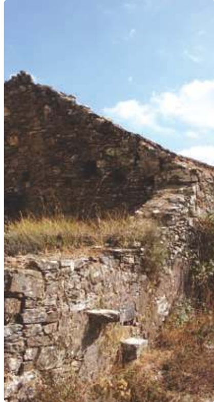
Pêro de Elvas Pêro de Elvas Village

Nos Besteirinhos, pequeno monte de casas com as pequenas hortas em redor, é possível observar o Vale da Ribeira de Odeleite que nasce nos arrebaldes desta Serra, indo desaguar no Rio Guadiana.