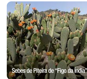
Sebes de Piteira de “Figo da Índia”