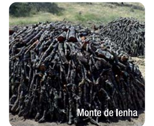
Monte de lenha