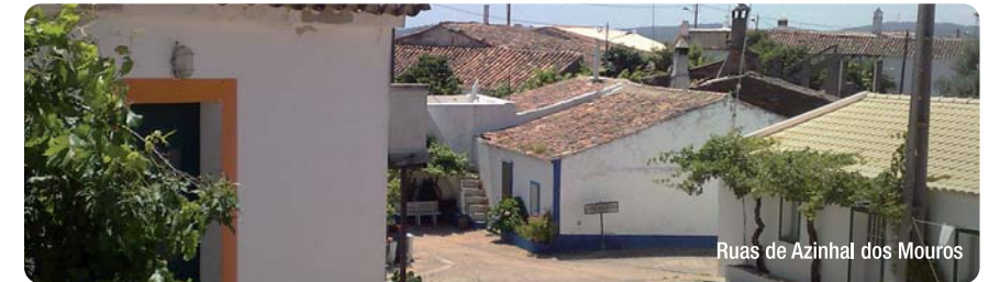
Ruas de Azinhal dos Mouros

Prossegue por esse caminho, atravessando de imediato a ribeira. Depois desta, o caminhante toma um trilho sempre ao longo da ribeira e terá ainda de cruzá-la por mais 3 vezes. A chegada à ponte sobre o Vascão, no cruzamento para Corte Pinheiro, revela o final do percurso. Deste ponto até à aldeia de Azinhal dos Mouros o itinerário repete-se.