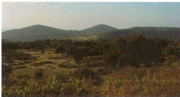
Serra de Monfurado