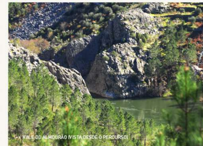
→ VALE DO ALMOURÃO (VISTA DESDE O PERCURSO)

Com uma vista imponente, onde nos sentimos pequenos, o Vale Mourão (ou Vale do Almourão) é um lugar inóspito e de difícil acesso. Caminhar no interior deste desfiladeiro com 400 metros de profundidade é viajar no tempo quase 500 milhões de anos, até uma era em que os duros quartzitos eram finas areias depositadas no fundo de um vasto oceano. Foram necessários uma mega colisão e 140 milhões de anos para transformar estes sedimentos em rochas metamórficas, e erguê-los dos fundos marinhos aos cumes das montanhas. A paisagem impressionante que hoje encontramos é o resultado de 250 milhões de anos de alteração química das rochas e da erosão ao longo de tempos inimagináveis.