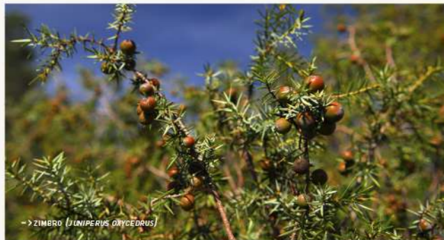
→ ZIMBRO ( JUNIPERUS OXYCEDRUS )

Pelas encostas escarpadas, subsiste uma área considerável de zimbrals, sobre solos rochosos de quartzitos, muitos fraturados, com escassa retenção de água, que se escoam facilmente para o subsolo, logo, tem que suportar uma seca estival mais prolongada. Nestas comunidades que incluem espécies termófilas, os zimbrs ( Juniperus oxycedrus ) não ostentam porte arbóreo, constituindo matagais mais ou menos densos. Com uma presença particularmente relevante, o zimbro é uma espécie-reliquia e rara que terá tido a sua grande expansão até há dois milhões de anos, adaptada a um clima de características mediterrâneas, mas muito seco e frio.