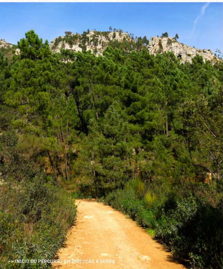
-> INÍCIO DO PERCURSO EM DIRECÇÃO À SERRA

Ocreza nos últimos dois milhões de anos, que parte a Serra das Talhadas em duas cristas quartzíticas. Em silêncio, pode observar os grifos, que tanto repousam nas rochas como planam o céu azul. Um pouco mais à frente, a 2,3 Km do percurso, deixe-se fascinar pela imponência das Portas do Vale Mourão.