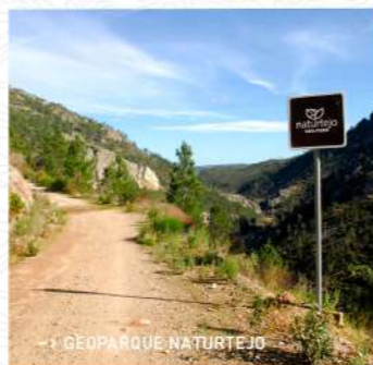
-> GEOPARQUE NATURTEJO

A vegetação frondosa, composta por plantas tão variadas como a esteva, os juncos, os fetos selvagens, os tojos ou o rosmaninho, e a frescura dos pinheiros serve de alento na fase final do trajeto. Passados 6,5 Km, chega-se, finalmente, a Carregais, uma aldeia pitoresca, cujas fachadas das casas, ora em xisto ora pintadas de branco, jogam com o verde e o vermelho dos pomares de cerejeiras, que em maio, junho e julho emprestam a cor a este lugar protegido pela serra. Nos meses frios de inverno, cheira ao fumo das lareiras e dá-nos vontade de permanecer mais tempo do que nós é permitido.