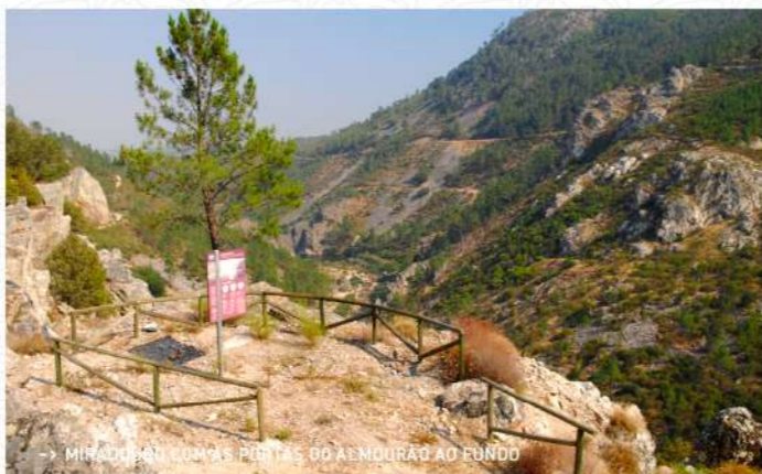
-> MIRADOURO COM AS PORTAS DO ALMOURÃO AO FUNDO

O percurso tem início em Sobral Fernando, a aldeia que assinala o início a sudeste do concelho de Proença-a-Nova. Separada da vizinha Foz do Cibrão, concelho de Vila Velha de Ródão, pelo Rio Ocreza, esta povoação de casario de xisto e de paredes caiadas de branco vale pela hospitalidade e simplicidade das suas gentes, sempre dispostas a dar informações, caso as solicite. Prepara-se para a caminhada porque os seus olhos vão perder-se numa das paisagens mais belas da região. Depois de deixar a aldeia, irá percorrer um pequeno pinhal, onde a sombra e o aroma das árvores lhe servem de ânimo. À medida que começa a subir, é a vista magnífica sobre as aldeias de Sobral Fernando e Foz do Cibrão, arrumadas pelo Homem nas encostas da Serra das Talhadas, com o Rio Ocreza ao fundo, que domina as atenções. A cerca de 1,3 Km, pare nos miradouros, onde estão disponíveis informações sobre a história e a biodiversidade deste lugar selvagem. Com três pontos de observação estratégicos, sintá a altivez das encostas escarpadas do Vale Mourão, uma garganta escavada pelo Rio