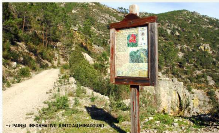
→ PAINEL INFORMATIVO JUNTO A Q MIRADOURO