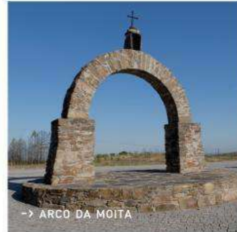
-> ARCO DA MOITA

Construído em xisto, a pedra dominante na região de Proença-a-Nova, e em data indeterminada, diz-se que o Arco da Moita foi erguido por agradecimento a Nossa Senhora. O povo conta que uma criança que passava todos os dias neste sítio, a caminho da escola, muitas vezes, já noite escura, sentia medo e chorava. Até que um dia apareceu uma Senhora vestida de branco que o encorajou e lhe disse para estudar muito que, quando crescesse, iria ser padre. A partir desse dia, o rapaz nunca mais sentiu receio. Estudou e, quando se formou, ergueu o arco como símbolo da porta da coragem. Há poucos anos, a autarquia mandou reconstruir o arco, depois de um camião o ter derrubado acidentalmente.