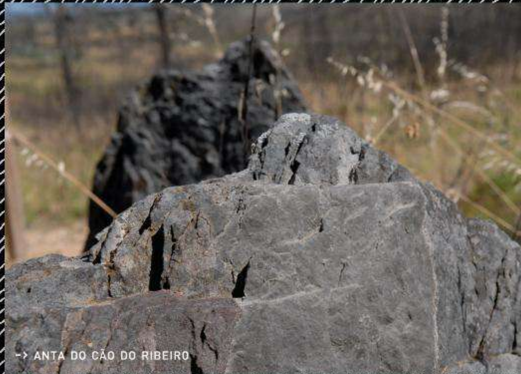
→ ANTA DO CÃO DO RIBEIRO

Com um cenário amplo, aromatizado pelos jovens eucaliptos que insistem em ser mais fortes do que os incêndios, e com dezenas de aerogeradores ao longe, avançamos escassos metros para chegar à terceira Mamoá do percurso. No Cabeço da Anta, como é denomi-