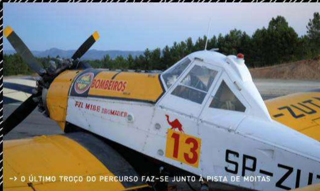
→ O ÚLTIMO TROÇO DO PERCURSO FAZ-SE JUNTO A PISTA DE MOITAS