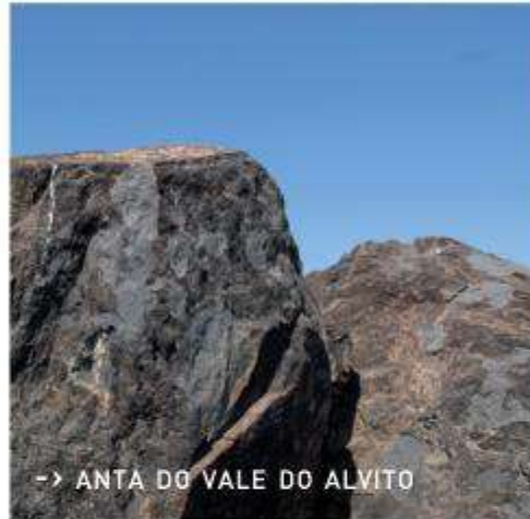
-> ANTA DO VALE DO ALVITO