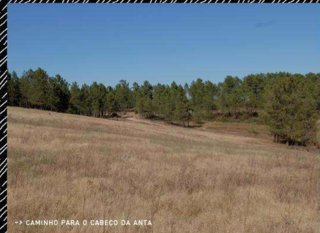
-> CAMINHO PARA O CABEÇO DA ANTA

Neste percurso poderão ser observados: raposa ( Vulpes vulpes ), ginete ( Genetta genetta ), saca-rabo ( Herpestes ichneumon ), javali ( Sus scrofa ), lebre ( Lepus capensis ), coelho ( Oryctolagus cuniculus ), perdiz vermelha ( Alectoris rufa ), gralha preta ( Corvus corone ), gaio ( Garrulus glandarius ), mocho galego ( Athene noctua ), peneireiro de dorso malhado ( Falco tinnunculus ), entre outros.