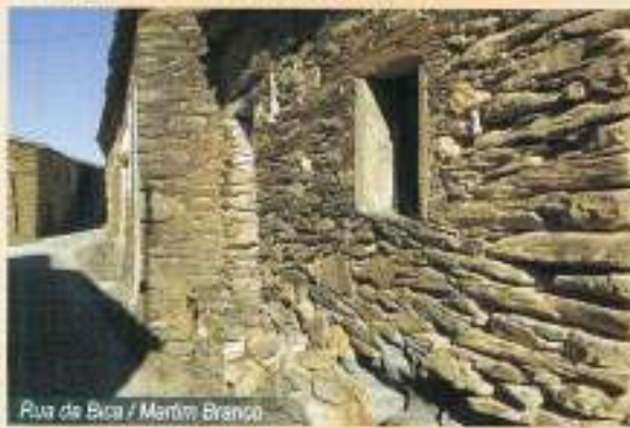
Rua da Bica / Martim Branco