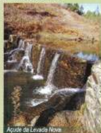
Açude da Levada Nova

Os açudes destas levadas, construídos com placas de xisto, ao alto, perfeitamente enfiladas entre si, constituem curiosos monumentos à engenharia hidráulica testemunhando a qualidade de construção dos nossos antepassados.