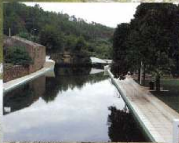
Praia fluvial - Almaceda

O estudo, levantamento e implantação deste PR foi feito, em 2008, por NatuVerde para a Câmara Municipal de Castelo Branco. www.natuverde.pt