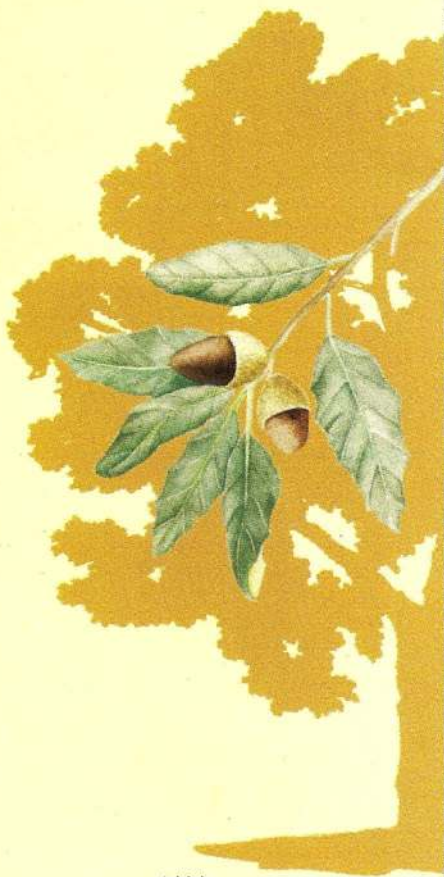
Azinhreira Quercus rotundifolia