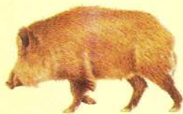
Javali Sus scrofa

Ultrapassado o rio e chegados ao alto da superfície que se separa do curso da ribeira de Labiados, localmente apelidada de rio Frio, o percurso começa por seguir por entre terrenos agrícolas abandonados que paulatinamente vão sendo ocupados por diversas espécies arbustivas, com destaque para as giestas amarela e branca, a arçã e a esteva. Atente-se nesta fase de evolução do coberto vegetal para uma etapa arbustiva que, depois do abandono agrícola, se revela fundamental para a conservação e recuperação ecológica, nomeadamente ao travar a erosão dos solos, ao produzir matéria orgânica e ao criar refúgio para diversas espécies animais, como a perdiz-vermelha, a raposa ou o javali.