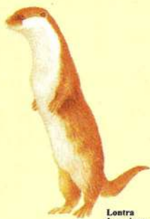
Lontra Lutra lutra

A travessia do curso do Onor terá de ser efectuada com recurso às poldras colocadas na continuação do caminho, do lado direito. Este rio nasce em Espanha, na parte ocidental da serra da Culebra, percorrendo um total de cerca de 30 Km até desaguar no rio Sabor. O caudal do rio é irregular, mas alberga as espécies de peixes mais comuns na região (truta, boga, escalo, barbo). Amieiros, freixos, salgueiros e choupos formam exuberantes cortinas em cada uma das suas margens, e por detrás delas vislumbram-se extensos contínuos de pastagens de regadio (lameiros de feno). As margens deste rio servem também de refúgio à lontra e ao cágado, cujos movimentos poderão surpreendê-lo se estiver vigilante, tal como o voo do guarda-rios.