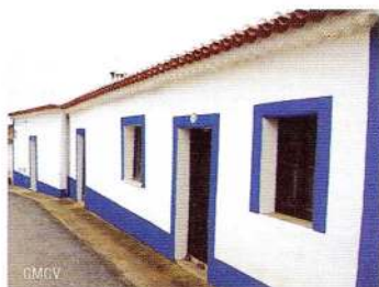
Casario em Salto

As Serras de Alcária e de São Barão acompanham, em pano de fundo, todo o percurso até à Senhora de Aracelis, um importante afloramento quartzítico. Observam-se ainda zonas de terras muito vermelhas que denunciam a presença de ferro, tanto à passagem nos montes da Chanquina e da Cerquinha como à chegada ao Salto, aquando do regresso.